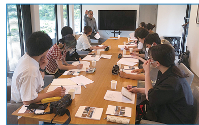
九産大とのコラボの様子

九産大とのコラボについては、学生からのフレッシュなアイデアをいただいたことで、とても良い刺激になりました。今回の取り組みが、若い方々にも「秋月クラフトビール」を手にとってもらえるきっかけになればと思います。