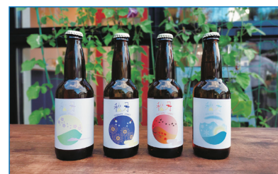
九産大とのコラボによる新しいラベル

今後はSNSを活用した集客強化やHPの強化による効率化を図っていきたくと思っています。また秋月城下町醸造所工房内を改装し、販売所兼レセプション兼角打ち試飲のスペース、観光客、宿泊客に販売促進する取り組みを行っていきたくと考えています。