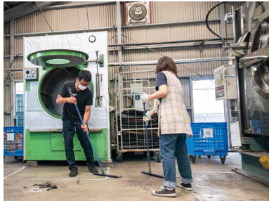
スタッフが自主的に改善を実施

まず、工場長自らが高圧洗浄機を手に、長年の汚れを洗い流すことから始めたことで、スタッフの意識が徐々に変わってきたように感じます。