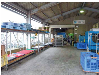
工場内が整理整頓されて作業効率が向上

また、ボイラーから乾燥機への送給配管を太いものに変更したことで、5台の乾燥機で乾燥にかかる時間が安定して、これまで乾燥機によっては30分以上かかっていたものが最短16分に。5台平均で4分以上短くなりました。さらにボイラー用の灯油使用量を約10%削減することができました。