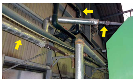
ボイラーと乾燥機をつなぐ配管の細さがネック