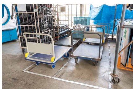
台車の置き場所をラインで明示

さらに、乾燥工程がボトルネックと特定。特にフル稼働時、乾燥時間のバラツキが顕著であることを突き止めました。専門家も交えて調査、分析すると、乾燥機を順に増設したことによる熱供給システムの能力不足と判明。送給圧力に着目し測定したところ、ボイラー本体の問題ではなく、熱供給配管が細く長く、圧力損失が増大していたため、特に顕著なメインの配管を太いものに取り替えました。