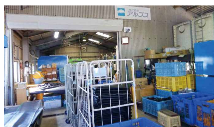
雑然としたものを迂回しながら作業