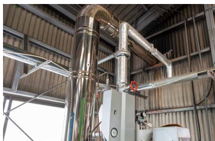
配管のみの安価な改造で供給能力を確保